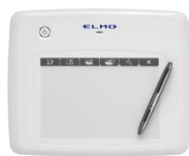
ワイヤレス・ペンタブレット CRA-1