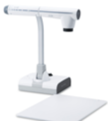
インタラクティブ書画カメラ

また、ワイヤレス・ペンタブレットは、「L-12」のズーム機能などをリモートでコントロールすることができるため、子どもたちの発表を教室後方からサポートしたり、机間指導しながら大画面へのかき込みを行って指導したりすることも可能となり、教員と児童のよりインタラクティブなコミュニケーションを実現します。