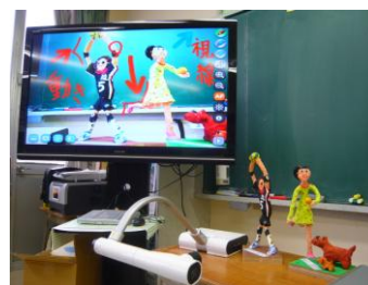
「みエルもん」で映した児童の作品に、「かけるもん」で注意点をかき込みしている様子