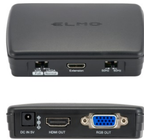
CONNECT BOX (セットモデル付属)

学校教育のICT化が進むなか、書画カメラ(実物投影機)は教室に定番のICT機器として幅広く認知され、世界的に普及が進んでいます。その大きな理由の一つが、書画カメラが教科書などの紙媒体や模型などの実物教材とPCやネットワークを介したデジタル教材を橋渡しする役割を持ち、操作が簡単で子供たちにわかりやすい授業を行うために便利な道具というところにあります。