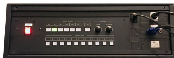
設置例 2 AV ラックへ収納

当社の AV コントロールシステム CVAS(シーバス)は Controller for Visual Audio System の略語で、昭和 62 年の製品発売以来、数多くの企業の会議室や大学等の講義室、博物館や美術館などにご利用いただいている国内唯一の映像・音響機器のコントロールシステム製品です。