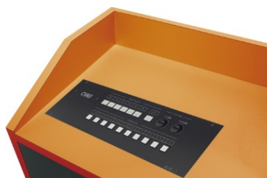
設置例 1 操作卓へ埋め込み (操作パネルと本体を分離して設置)